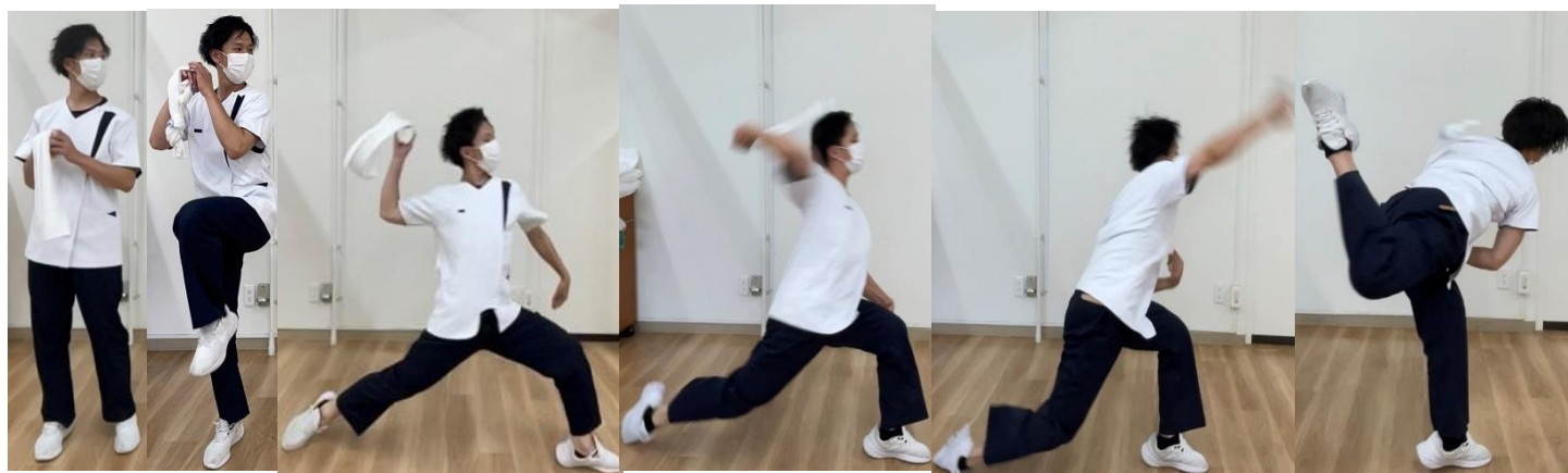
ワインドアップ | 早期コッキング | 後期コッキング | 加速期 | フォロースルー