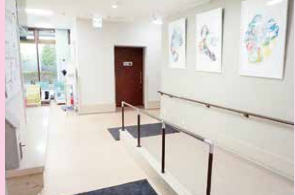
スロープが設置され、スリッパへの履き替えがなくなりました