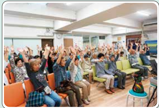
ご参加ありがとうございました