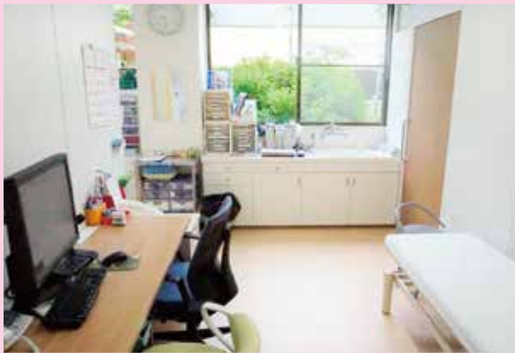
診察室の工事も完了しました