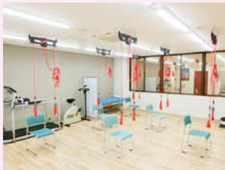
新しいデイケアルーム

令和元年6月1日から新しいデイケアルームでデイケアが始まりました。当院のデイケアは1回100分で行います。月曜日・火曜日・木曜日・金曜日は1日5回行います。16：30～18：10は要支援の方のみサービスを利用できます。水曜日・土曜日は1日2回行います。9：00～16：25のご利用の方には送迎サービスをご利用いただけます。