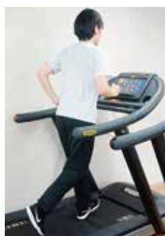
持久力 トレーニング マシン