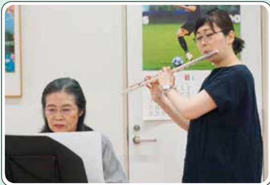
フルートの実演をしていただきました