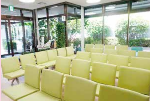
ロビーの椅子を新しくしました