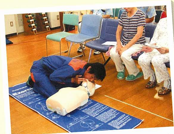
人工呼吸をして、相手に空気を送り込みます。