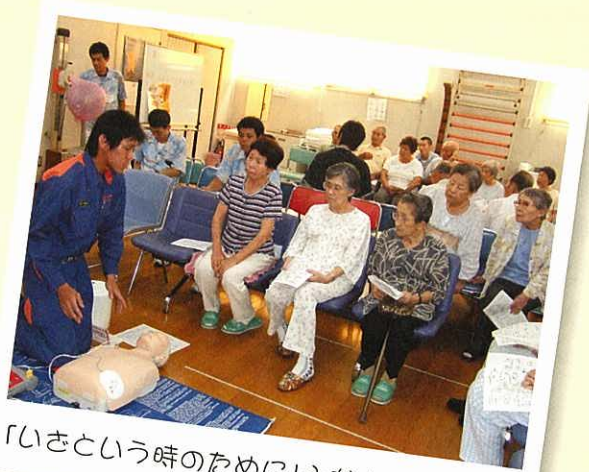
「いざという時のために」みなさん真剣であ。