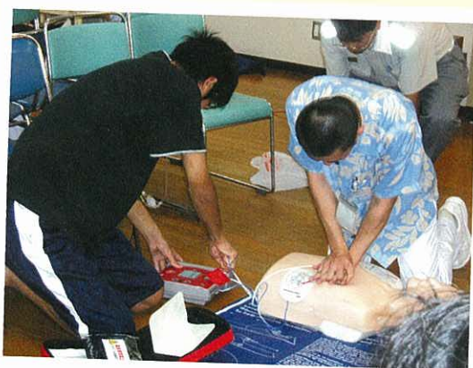
2人で救命手当を行っています。