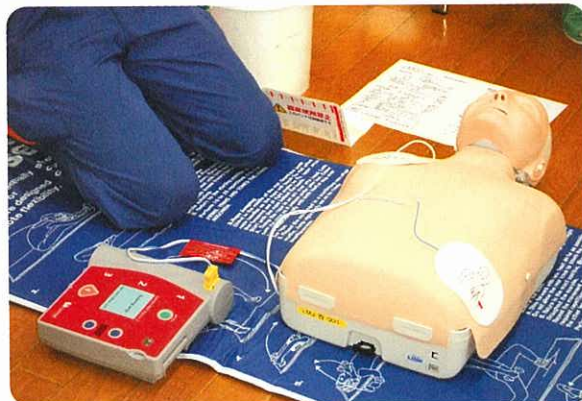
AED(自動体外式除細動器)

現在では、不特定多数の人が集まる駅、競技場などの公共施設やスーパーマーケット、スポーツクラブなどに設置されてきています。平成16年7月からは、一般市民による、AEDの使用が認められています。