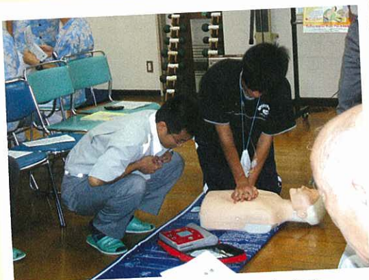
手を合わせて真上から押します。