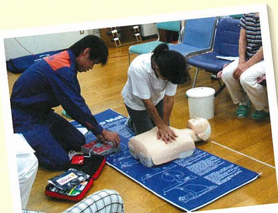
心臓マッサージ体験中であ。

平成 18 年 8 月 28 日火曜日、「救命手当について」をテーマに第 125 回健康教室を開催しました。尼崎西消防署の救急隊による心肺蘇生法の講習を行いました。健康教室に参加していただいた方にも実際に心肺蘇生法や、AED(自動体外式除細動器)の使い方を体験してもらいました。